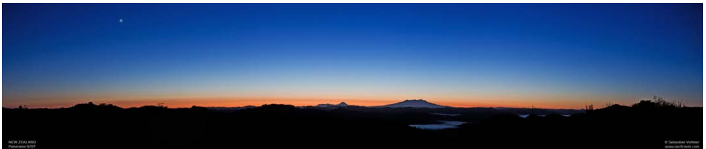
Morgenstimmung über dem „Forgotten Highway“ in Neuseeland

2007 zog es mich nach Neuseeland, wo ich zusammen mit einer Künstlerin an einem Wettbewerb für Kleiderskulpturen (aus Astrofotografien) teilnahm. Im Gepäck ein Stativ von Manfrotto, Objektive, Kameras, Kugelkopf, Akku und erstmals der AstroTrac TT 320.