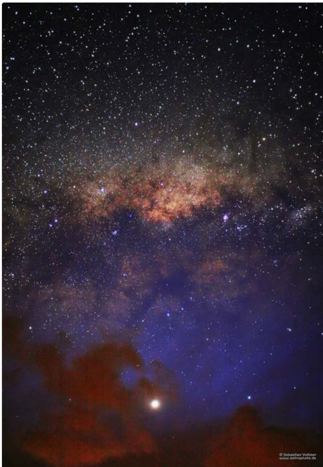
Milchstraßenzentrum über einer Gewitterfront in Neuseeland. Unten im Bild steht der helle Planet Jupiter.

Als einige Aufnahmen im Kasten waren, bahnte sich plötzlich erneut ein Gewitter an. Ich schnappte die Geräte, ließ aber das Stativ stehen. Der Regen prasselte auf das Wohnmobil und überall zuckten die Blitze. Die Wolken zogen ab. Der Himmel war wieder glasklar.