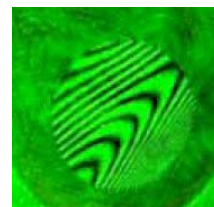
Interferogramm des Neodymium Filters eines US Anbieters

Seitdem wir eigene Filter und Filterserien produzieren, lassen wir immer wieder an einem breiten Querschnitt von „Billigfiltern“ der verschiedensten Hersteller Kontrollmessungen der optischen Qualität durchführen (siehe Abbildung rechts).