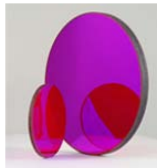
Baader D-ERF Filter

Optische Qualität hat ihren Preis, daher ist es auch kein Wunder, wenn Beobachter beim Einsatz von Billigfiltern vor einem Binokular, vor Telekompressoren oder Barlowlinsen visuell und fotografisch über „unerklärliche“ Bildverschlechterung klagen. Je höher die Vergrößerung wird, desto weicher und „zermatschter“ erscheint bei einem Billigfilter das Bild, egal ob es sich um visuelle oder fotografische Beobachtung handelt.