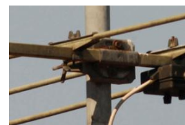
bei 16 mm Okularbrennweite