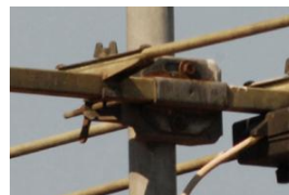
bei 08 mm Okularbrennweite