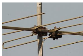
bei 24 mm Okularbrennweite

Zeiss Diascope 85 T/FL mit Baader Hyperion Zoom-Okular (#2454824), mit Hyperion Zoom T-Ring M43/T-2 (# 2958080) und Kamera T-Ring (hier Nikon T-Ring) plus notwendiger Abstandshülse T-2 40mm #1508153 ergibt fünf Vergrößerungen: