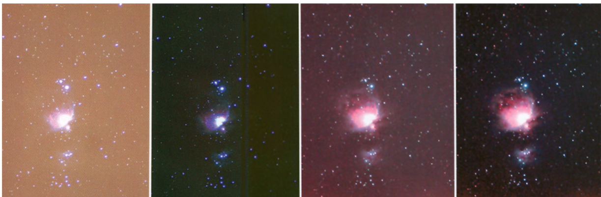
Von links sind Abbildungen der jeweils gleichen Region im Orion zu sehen: Zunächst ohne Filter und daneben mit herausgerechnetem Streulicht. Dann ein Originalbild mit UHC-S-Filter, daneben mit schließlich geringer Nachbearbeitung.

Die Aufnahmeserie bestätigt die visuell gewonnenen Eindrücke: Die orangerote Lichtverschmutzung, die auf der ersten Photographie zu erkennen ist, wird vollständig beseitigt, wie die daneben stehende dritte Photographie im direkten Vergleich eindrucksvoll zeigt. Beides sind jeweils nicht weiter am PC bearbeitete Originalbilder. Versucht man aus dem ersten Bild den Farbstich zu entfernen, so wird natürlich auch die Farbbalance des Gasnebels verfälscht, wie das daneben stehende Photo aufzeigt. Zudem kommt dann der blaue Farbfehler des Objektivs stark zur Geltung.